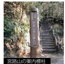
宮路山の案内標柱

観光案内表示を充実させるため、市内各地の観光スポットに案内標柱などを設置しています。