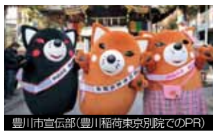
豊川市宣伝部(豊川稲荷東京別院でのPR)

広報・シティセールス活動をサポートする仮想組織「宣伝部」を設置しています。宣伝部長「いなりん」をはじめ、3体のゆるキャラが役職に就き、イベントやメディアに出演するなど、まちのPRに励んでいます。