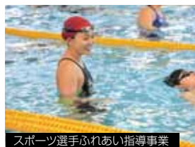
スポーツ選手ふれあい指導事業