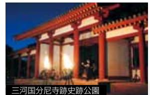
三河国分尼寺跡史跡公園