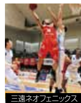
三遠ネオフェニックス