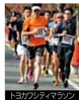
トヨタワシティマラソン