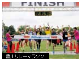
豊川リレーマラソン