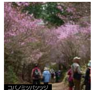
コバノミツバツツジ