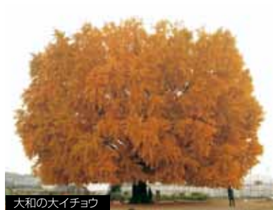
大和の大イチョウ