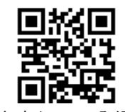
とよかわ安心メール登録用QRコード

【空メールやQRコードからの登録方法】 tovokawa@entry.mail-dot.jp