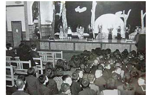
昭和29年当時の学芸会