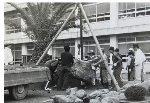
昭和45年 移転後の整備