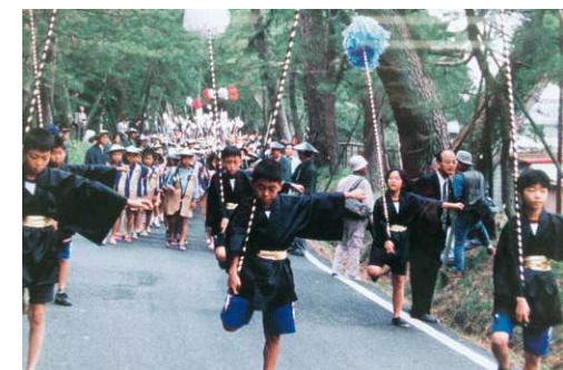
平成6年当時 松並木フェスタin御油

宿場として栄えた御油に、明治6年11月1日、地域住民の念願でもあった学校が、現在のイチビキ豊川工場付近にあった旧本陣、鈴木氏宅を借用し、第二大学区第四十五番御油小学校として設立された。その後、移転、改名、校舎の新・改・増築などを経て、豊川市へ合併。昭和44年、児童増加に伴い校舎の移転新築を余儀なくされ、地域住民の行政への熱心な働きかけと自らの資金集めや建設予定地の開墾を経て、現在の学び舎が完成した。校区が一町で構成されていることもあり、地域と深く関わりながら数多くの歴史を刻んできた。