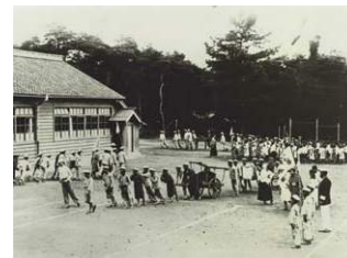
避難訓練と少年消防隊(S8)