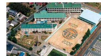
100周年記念航空写真(H18)

本校は明治40年小学校令改正とともに桑富第1・第2・第3尋常小学校が合併し一宮西部尋常小学校創立となった。今年度で創立109年となる。前庭には、学校のシンボルツリーもちの木があり、対になって樹齢130年以上の大松(黒松)もあったが、昭和53年に枯死伐採され、現在は玄関の衝立として残っている。以前は、マーチングバンドの活動が盛んで、昭和62年度には全国大会に出場している。また、花壇作りにも力を入れており、昭和44～46年度には花いっぱい運動で表彰を受けた。平成18年度には創立100周年の式典が盛大に行われた。児童数は、創立当時253名で、昭和58年度に最多の802名となり、現在は578名である。