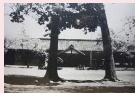
もちの木と黒松(S30頃)