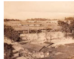
大木火の見櫓より(S26)