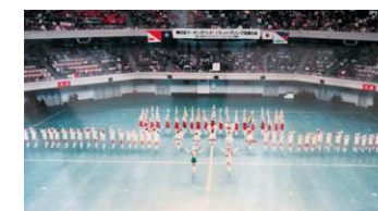
マーチングバンド全国大会出場(S62)