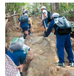
全校での本宮山遠足(H26)