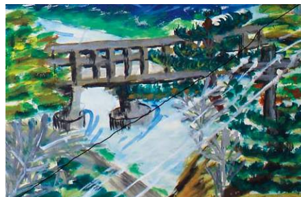
写生会の優秀作品(S32) 上から3年、4年、5年

校歌 一春りよう乱の麓原 赤くかがやくつつじ花 そそり立ちたる本宮は 若き緑に栄ゆなり 二秋 玲瓏の月さやか 吉祥山をはなれたり 水に映りしその影は 濁りに染まぬ我が友よ 三山川の秀 今ここに こりてぞ集う我が友よ 睡みも堅くいざやいざ 学び極めんもろともに