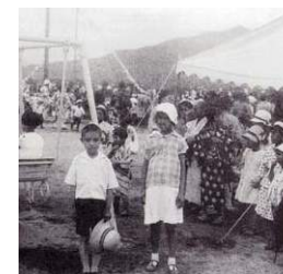
長山遊園地の行事(S15) 樹林舎刊 「豊川・新城・蒲郡・北設の昭和」より

本校は、校区にそびえる本宮山と豊かな流れの豊川に囲まれた、自然豊かな学校である。江島橋ができ、江島の分学校が統合されて、今の一宮東部小学校になった。校区が広いために、飯田線を使って電車通学が行われた時期もあった。地域では節目ごとに本宮山に登る伝統があり、そうした思いを大切にしながら、全校での本宮山遠足に取り組んでいる。何ごとにも誠実に取り組む校風は、校訓である「正しく」「強く」「明るく」を守り伝えてきた証しといえる。