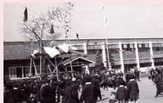
新校舎竣工式と餅投げ(S35)