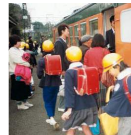
電車通学の登校風景(S45)