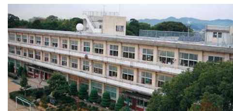
現在の南校舎(S48竣工)

本校は、寺子屋・私塾時代を経て、明治6年伊奈学校から始まる歴史ある学校である。明治13年に西洋風の校舎を創設。その後、児童数の増加に伴い、何度も校舎や運動場の増改築を繰り返した。また、昭和43年に、当時最先端の屋内体育館を竣工した。昭和57年には、児童数1,196名という東三河地方の中でも有数の大規模校であった。平成27年7月現在、児童数637名、23学級となっている。