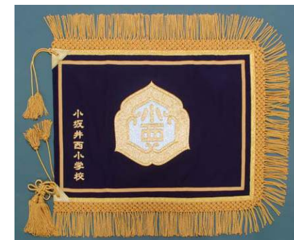
開校100周年記念の際に、新調した校旗