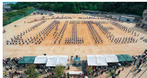
全校によるマスゲーム (H26)