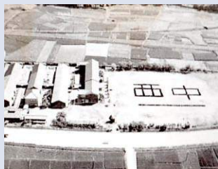
開校当時の西部中 (S20年代)

戦後、昭和22年に誕生した西部中学校の校章は、平和の象徴である「鳩」と西中の文字を組み合わせて作成されている。現在、音羽川に面した校舎壁に大きく掲げられている。