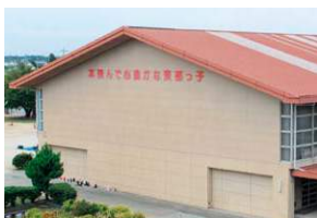
読書活動についての立体スローガン

昭和38年4月、睦美、麻生田、三上の3つの小学校が合併し豊川市立東部小学校は誕生した。開校当時の児童数は492名で、新校舎が完成した翌年9月までは、3つの分教場で分かれて学んだ。