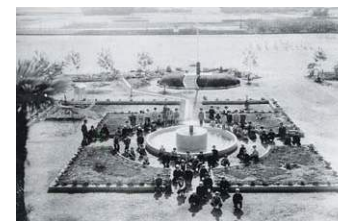
運動場・噴水・花壇(S40)