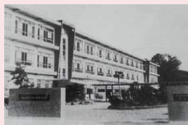
開校当時の校舎と正門