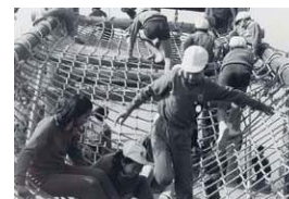
アスレチック完成(S53)