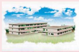
新校舎完成予想図(H28)