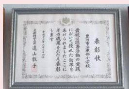
読書文部科学大臣賞受賞(H13)