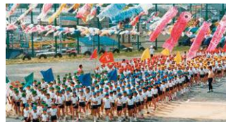
開校当時の豊小学校