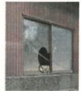
窓が割れた管理不全空家