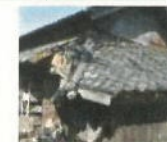
緊急代執行を要する崩落しかけた屋根