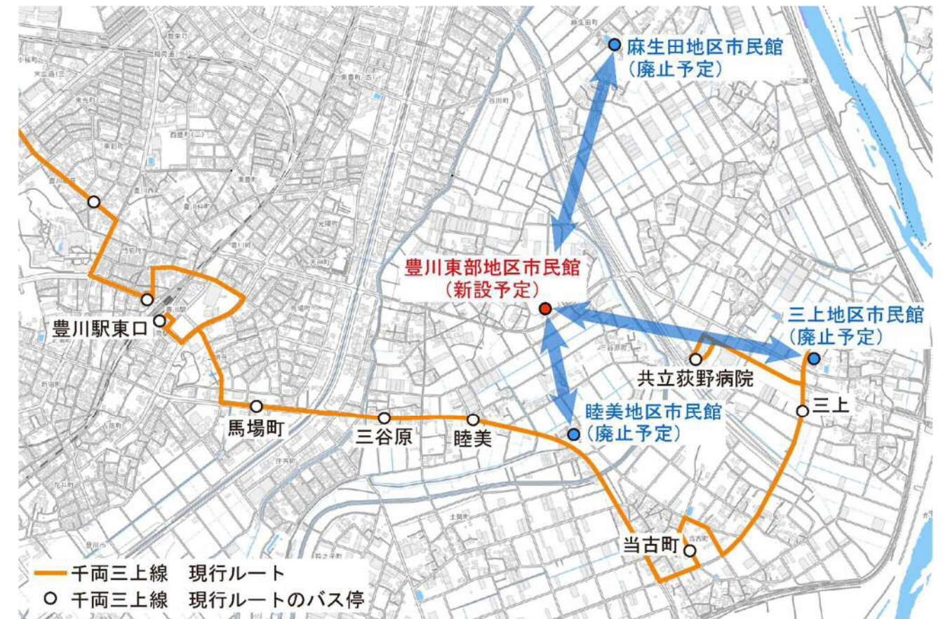
豊川東部地区市民館新設予定地