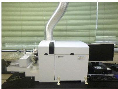
誘導結合プラズマ質量分析装置 （ICP-MS）