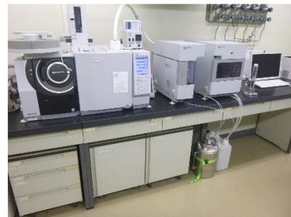
パーティクルトラップ・ガスクロマトグラフ質量分析装置 （PT-GC-MS）