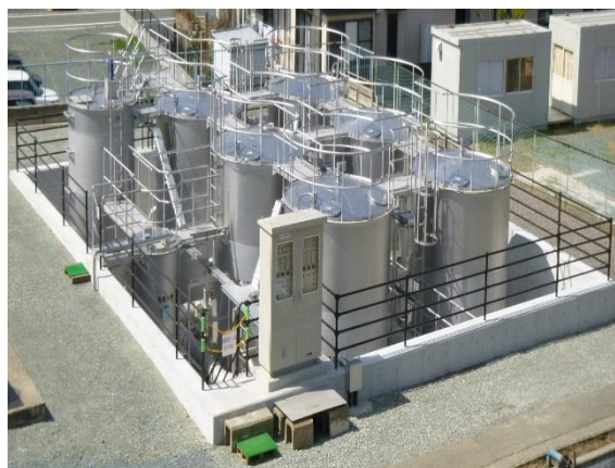
急速ろ過設備（一宮浄水場）