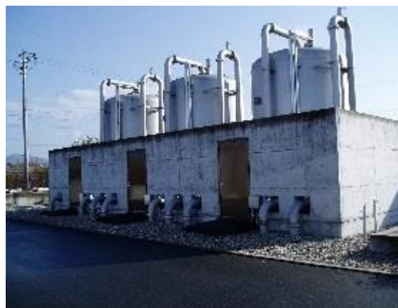
除鉄・マンガン処理設備(三上水源浄水場)