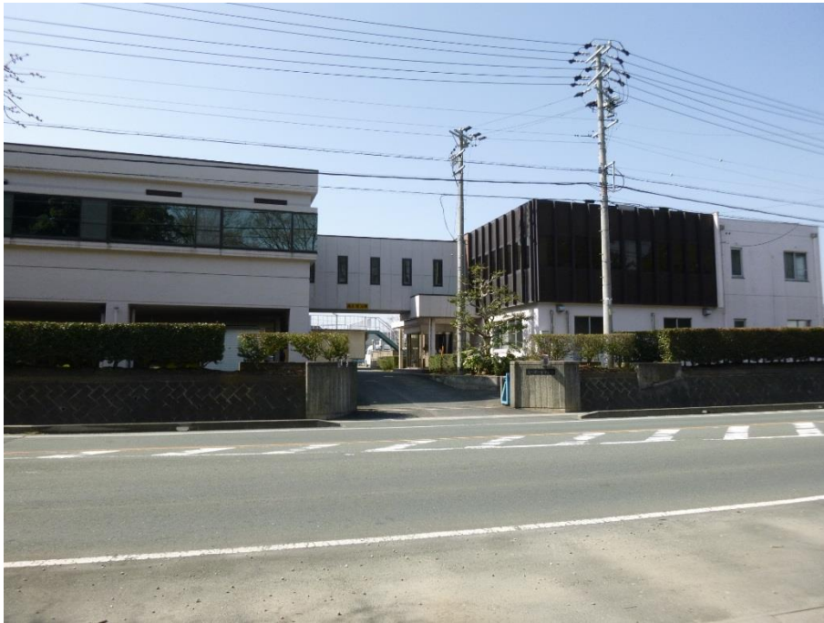
豊川市一宮浄水場