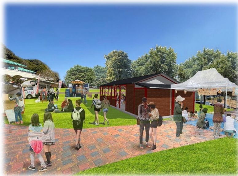
アニアニまる前の広場

新しく生まれ変わった赤塚山公園を皆様にお披露目できるよう、安全に工事を進めてまいりますので、令和5年度の開園30周年まで、お待ちください。