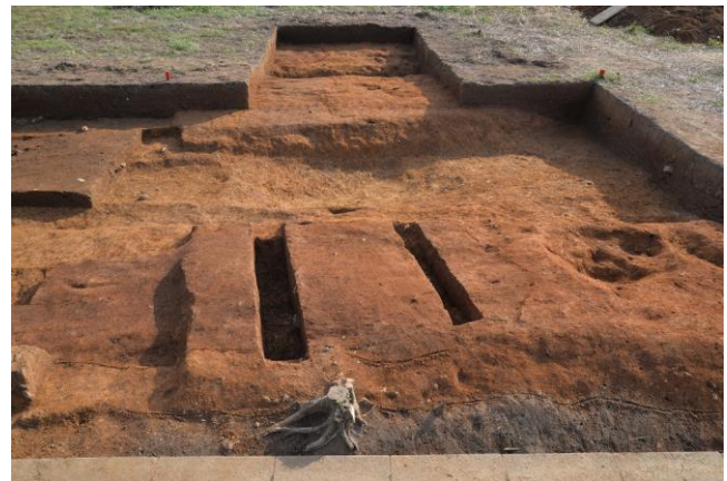
塔跡北側発掘調査箇所

国分寺は国分尼寺と併せ奈良時代に聖武天皇の命により国ごとに置かれた寺院で、その正式名称を「金光明四天王護国之寺」と称し、三河国の国分寺・尼寺跡は豊川市八幡町に所在しています。三河国分寺跡は大正11年に国の史跡指定を受け、昭和60年より史跡の公有化を進めるとともに、これまでに数回の発掘調査を実施してきました。