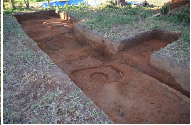
講堂跡北側発掘調査箇所