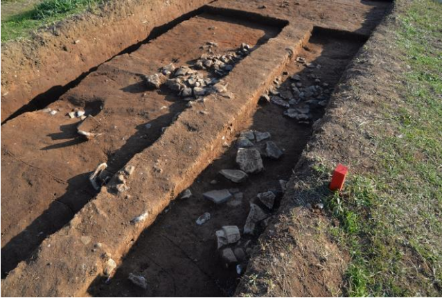
回廊跡発掘調査箇所