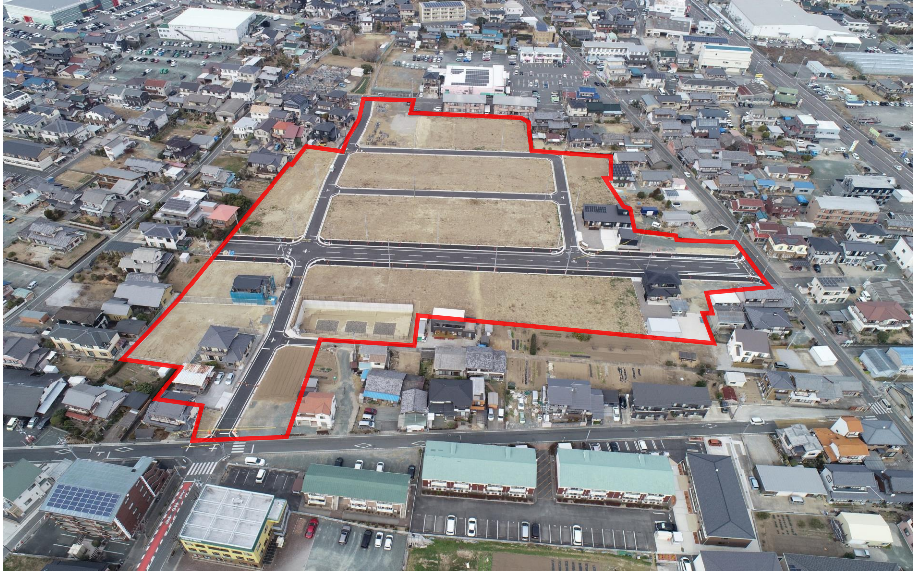
施行後(令和5年3月 撮影)