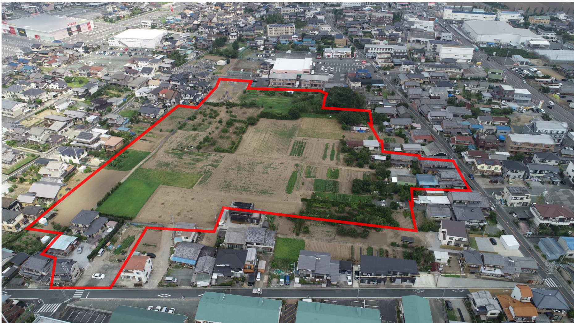
施行前(令和元年8月 撮影)