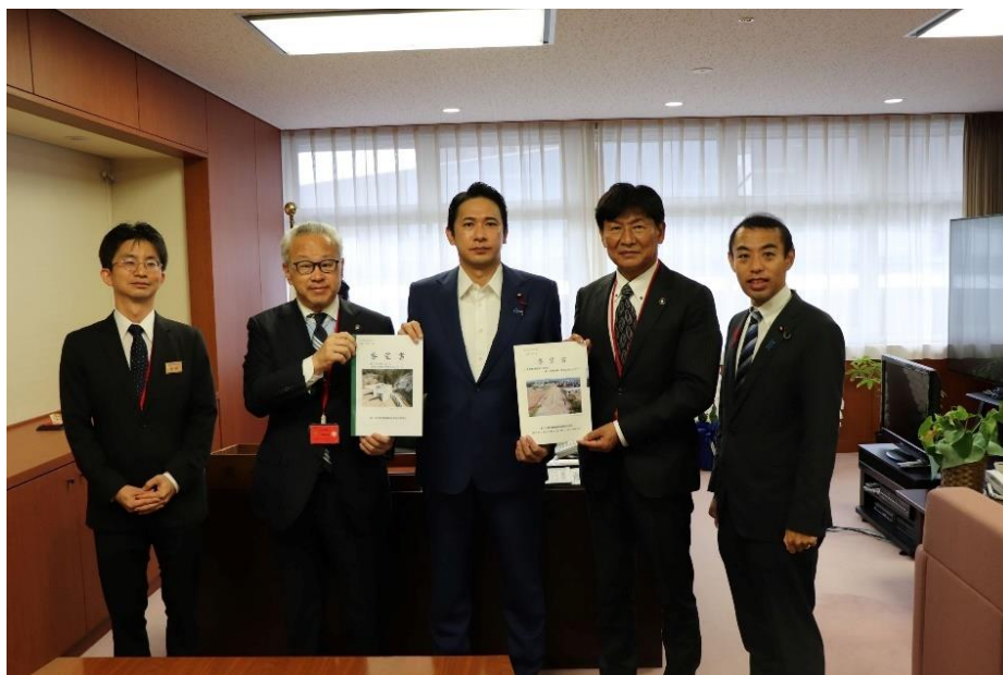
【写真】加藤竜祥国土交通大臣政務官へ要望書提出