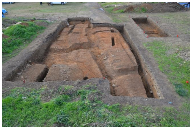
（仮称）西北院発掘調査箇所（（仮称）西北院東南隅）