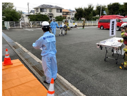
(事前訓練時のイメージ写真)