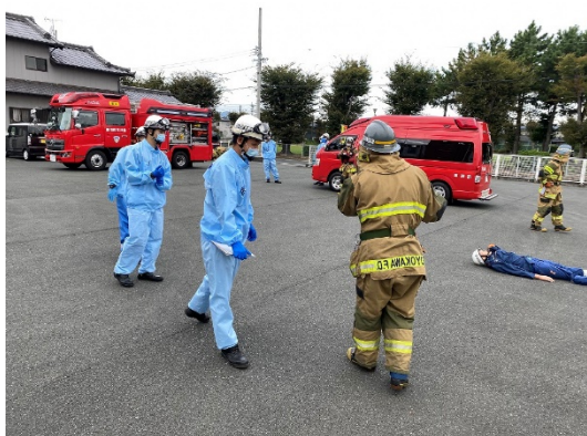
(事前訓練時のイメージ写真)