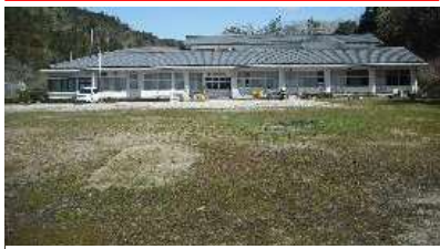
旧黄柳野小学校 外観