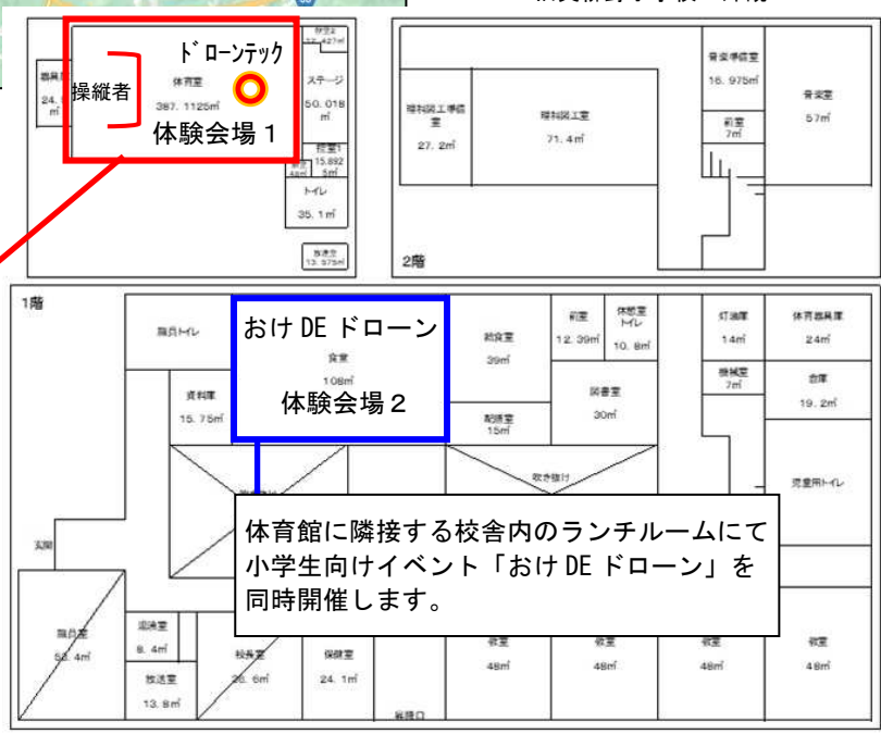
旧黄柳野小学校 図面