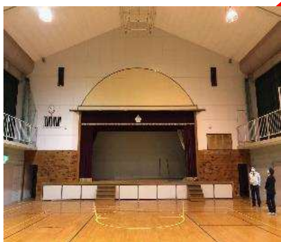
旧黄柳野小学校 体育館（体験会場）