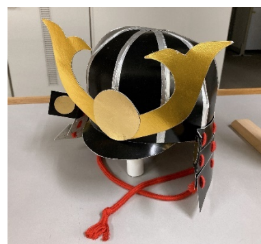
映像撮影のために児童が制作した兜 （生涯学習出前講座にて）