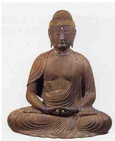
木造阿弥陀如来坐像