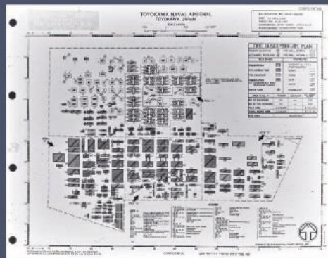
上空より撮影した写真を元に作成された豊川海軍工廠施設の分析資料 (国立国会図書館蔵、原資料：米国立公文書館)

作戦任務報告書 (国立国会図書館蔵、原資料：米国立公文書館) 豊川海軍工廠空襲の計画及び結果の報告書。目標の重要性として海軍兵器生産ではナンバー1であり、日本の主要な海軍工廠の一つであることが記されています。また、500ポンド爆弾を使用することについては、施設の構造上大量の爆弾で直撃することで目的を達することができることとされ、日本軍の反撃として20から30機の戦闘機が要撃してくることを予想していたようです。