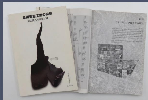
『豊川海軍工廠の記録 陸に沈んだ兵器工場』