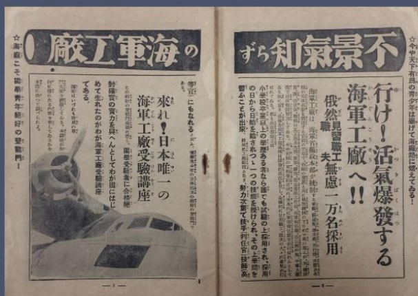
『海軍工廠受驗講座』(昭和13年)より