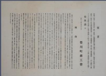
豊川町商工会宣言文

昭和11(1936)年、海軍は新設工廠として仮称「A廠」(後の光海軍工廠)と仮称「第二A廠」の建設計画を決定し、昭和13(1938)年6月1日に「第二A廠」の建設用地として、旧宝飯郡豊川町・牛久保町・八幡村にまたがる「本野ヶ原」と呼ばれる地域が選定されました。海軍の工場であれば、横須賀・呉・佐世保などの軍港に近い場所を選定するのが妥当かと思われませんが、「第二A廠」は艦船や航空機の機銃及びその弾丸など輸送が容易な兵器の生産を行う工廠で、必ずしも軍港に近い場所である必要はありませんでした。