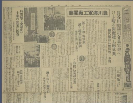
名古屋新聞(昭和14年12月15日付) 三河版に豊川海軍工廠の開庁に関する記事が大きく掲載されました。

昭和14(1939)年12月15日、豊川海軍工廠は開庁の日を迎えました。開庁時に完成していた施設はまだ第一機銃工場など一部で、初代工廠長には神保勉一少将が着任し、機銃部と火工部の二つの造修部門でスタートしました。この日、完成したばかりの建物内で行われた竣工式は午前11時から始まり、横須賀鎮守府司令長官の長谷川清大将、横須賀海軍建設部長、豊川海軍工廠長、豊川海軍工廠職員、横須賀海軍建築部職員ならびに工事関係者ら約100人余りが参列しました。