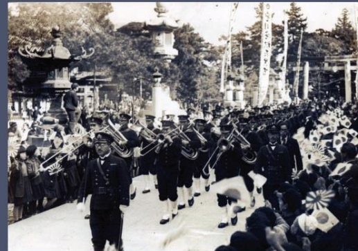
横須賀海軍軍楽隊の豊川稲荷での行進