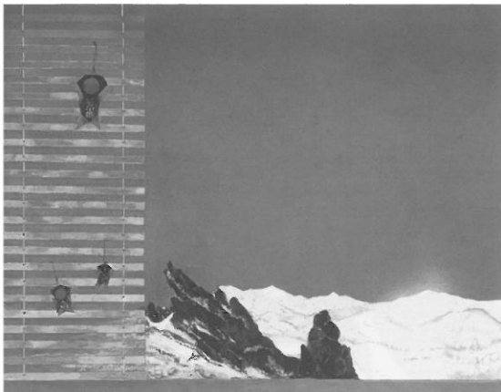
高畑郁子《狼ボロによせて》2008年