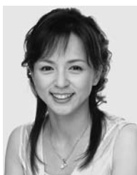
いとうまい子さん