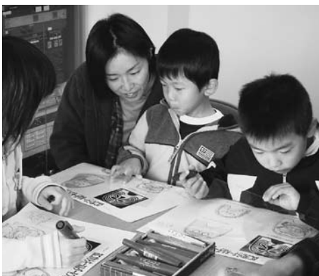
前回の親子ふれあい工房文化財教室の様子

日時 3月14日(土) 午前10時から正午まで ▼会場 三河天平の里資料館 ▼内容 竹を使った笛作り ▼対象 小学1年生から3年生までとその保護者 ▼定員 20組(1組2人まで) ▼参加費 無料 ▼申し込み 3月2日(月) から、先着順に受け付け。電話で、豊川子どもセンターへ