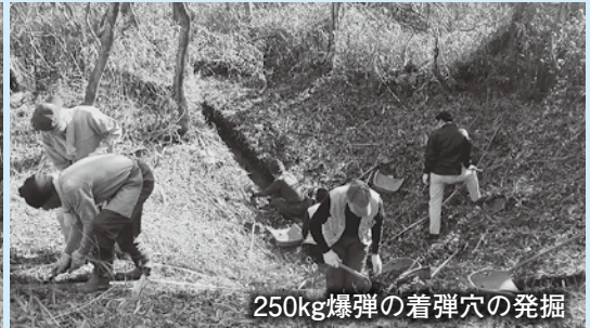
250kg爆弾の着弾穴の発掘

市では、旧豊川海軍工廠近代遺跡の調査報告会を行います。これは、平成21・22年度に実施した名古屋大学太陽地球環境研究所豊川分室の敷地を中心に、残存する海軍工廠の建物の図面作成や爆弾の着弾穴、防空壕の発掘調査などをもとに行うものです。