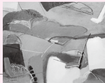
時を刻む / 2005年

た油絵を多く描きましたが、昭和40年代後半からは面と線だけで構成する抽象表現の明るく華やかなアクリル画を描くようになりました。