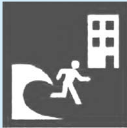
津波避難ビルの看板 TSUNAMI EVACUATION BUILDING

線テレホンサービスで放送内容の確認ができます（一部IP電話など利用できない場合があります）。右の電話番号を電話機の近くに控えたり、携帯電話に登録するように入ってください。ただし、通話料は本人負担となります。 詳しいことは、防災対策課（89局2194番）へ、お問い合わせください。