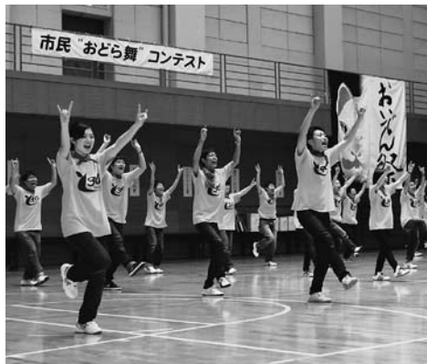
昨年のコンテストの様子

当日は名鉄国府駅から財賀寺(中田バス停)までの区間で臨時バスが約20分間隔で運行されます(国府駅の始発=午前9時、財賀寺の終発=午後3時33分)。