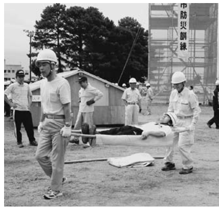
自主防災会の防災訓練の様子

災害対策本部用資機材整備、河川監視設備の整備、救出用資機材の整備を実施します。河川の越水などによる被害に備え、災害対策本部の体制を強化し、河川の水位監視装置などを整備します。