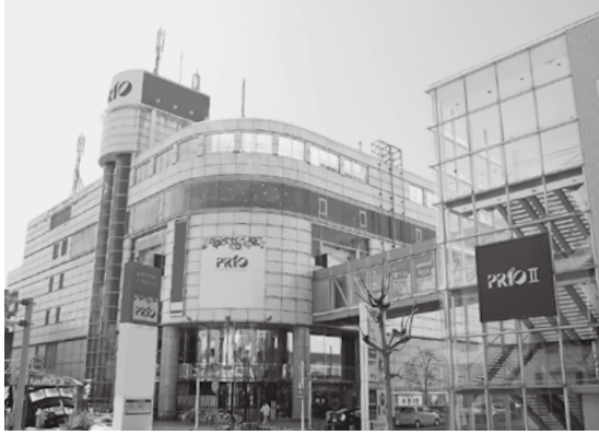
プリオビル4階にオープンします

4月1日(日)、プリオビル4階に「とよかわボランティア・市民活動センタープリオ」と「プリオ生涯学習会館」がオープンします。これらの施設は、市民の皆さんのボランティア・市民活動、多様な学習の場としてご利用いただけます。