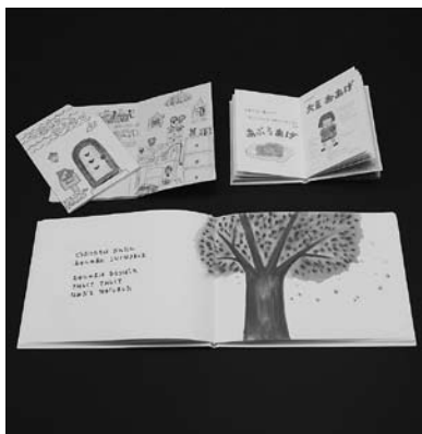
展示される手作り絵本

中央図書館 ☎85局5536番 すみれ絵本の会の会員などが製作した手作り絵本を展示します。期間 3月22日から4月17日まで（休館日を除く） ▶会場 中央図書館エントランスホール