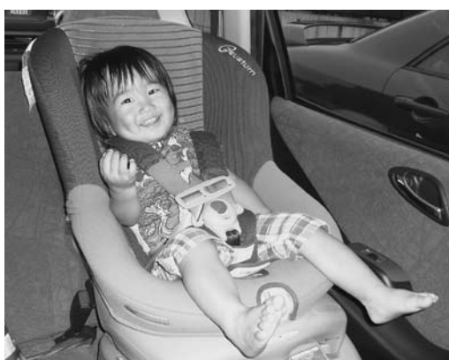
チャイルドシートを正しく着用しよう

期間中は市をはじめ各種団体が連携し、パトロールの強化や街頭広報活動、交通安全・防犯活動などをを行います。皆さんもこの機会に、安全なまちづくりの意識を高め、交通事故や犯罪被害の未然防止を心掛けましょう。