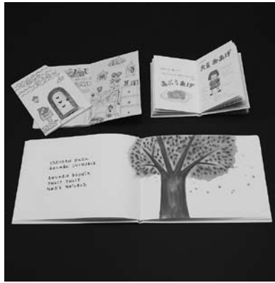
展示される手作り絵本

中央図書館 ☎85局5536番 すみれ絵本の会の会員などが製作した手作り絵本を展示します。期間 3月22日から4月17日まで（休館日を除く） ▶会場 中央図書館エントランスホール