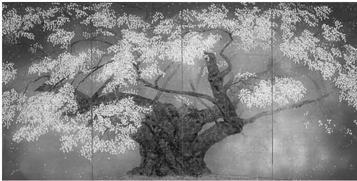
「樹霊淡墨桜」中島千波(おぶせミュージアム・中島千波蔵)

桜の名手として名高い、横山大観、菊池芳文、跡見玉枝、中島千波の他、菱田春草、小野竹喬、伊東深水、守屋多々志、後藤純男、平松礼二など、有名作家の優品を