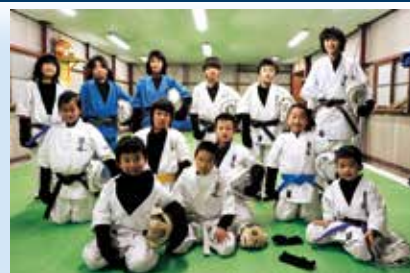
大道塾豊川道場少年部