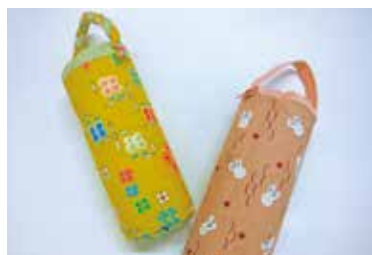
ビニール袋ストッカー

申込 ▶ 5月29日(金)まで(消印有効)。往復はがきに①講座名②郵便番号・住所③氏名④電話番号を記入の上、清掃事業課へ。1人1通だけ有効。応募者多数の場合は抽選