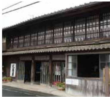
修理前の旅籠大橋屋