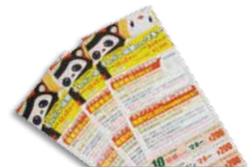
すわポン・狐娘ちゃんマネー