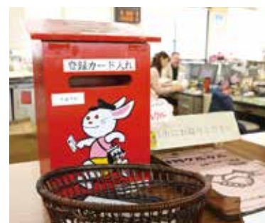
登録カード受付箱

申込 ▶ 毎月15日まで(翌月1日号に掲載)。登録カードに記入の上、直接、または郵送で、清掃事業課(北庁舎2階)へ。各支所、つどいの広場(プリオ5階)、ふれあいセンター、勤労福祉会館に設置の受付箱でも受付。情報誌と登録カードは、清掃事業課、各支所などにあります(HPからダウンロード可)