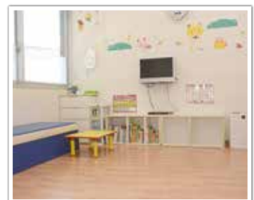
可知病院 病後児保育室