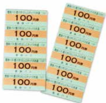
豊鉄バス・市コミュニティバス共通回数券

市では、高齢者の外出や社会参加を支援するため、豊鉄バスと市コミュニティバスの共通回数券を無料で交付しています。 対象 市内に在住の70歳以上で、市民税非課税の方 数量 1人年間100円券22枚(なくなり次第終了) 申込 申込者本人の印鑑をお持ちの上、直接、介護高