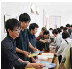
コンサートスタッフ