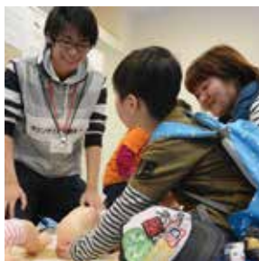
ふれ愛・みんなのフェスティバル