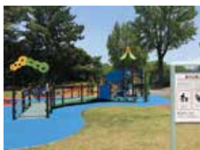
豊川公園子ども広場の整備