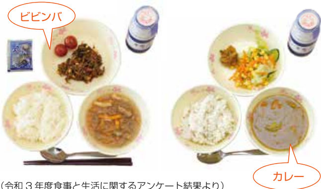
(令和3年度食事と生活に関するアンケート結果より)