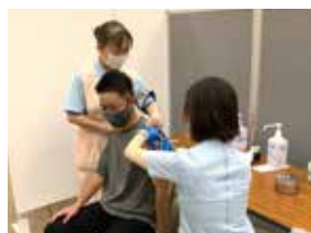
新型コロナウイルスワクチン集団接種