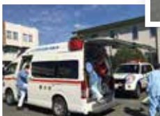
ドクターカーと救急車が合流する様子