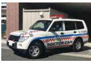
10月から運行を開始したドクターカー