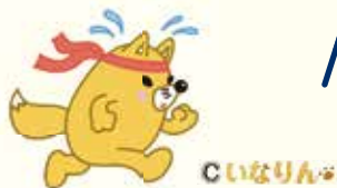
豊川市の過去の大会成績