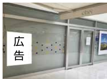
市催事場の壁面広告

申込 ▶ 2月1日～15日まで、申込書に広告原稿案、会社案内、市税・国民健康保険料(税)滞納情報にかかる同意書を添えて、直接、都市計画課(北庁舎3階)へ。申込書などは、HPからダウンロードできます