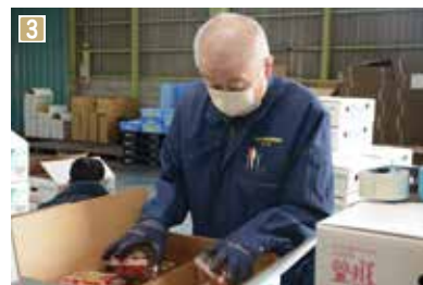
1 水分量を抑えて栽培することで、甘さを追求したハニーレット 2 土を使わず、水に肥料を溶かした液によって栽培する養液栽培 3 出荷場でも農協職員による検査を実施し、高品質を維持している