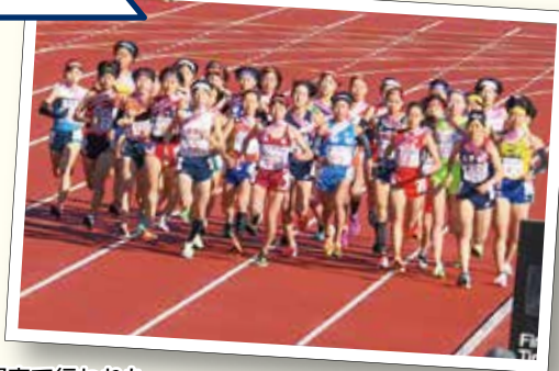
昨年12月に京都府で行われた 全国高等学校駅伝競走大会

例年、47都道府県それぞれ優勝した高校が出場する全国高等学校駅伝競走大会は、令和4年度で73回目。5年ごとに開催される記念大会を含め、市内からはこれまで、豊川高校男子駅伝部が9回、女子駅伝部が13回、豊川工科高校駅伝部が15回、出場しました。 令和4年度は豊川高校女子駅伝部が愛知県高校駅伝で優勝し、全国の舞台へ。市内で開かれたパブリックビューイングや会場では、多くの人がエールを送りました。結果は19位でしたが、全国の強豪相手に健闘する姿を見せてくれました。