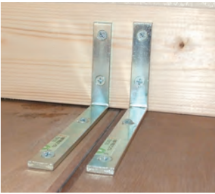
家具固定器具 (器具費用は1世帯平均約2500円)

対象 市内に在住の方 費用 無料(ただし、家具の固定に必要な器具やフィルムの代金は個人負担) 申込 5月10日から6月30日まで(消印有効)。申込書を、直接、または郵送で、危機管理課(〒442-18601諏訪1丁目1)へ。