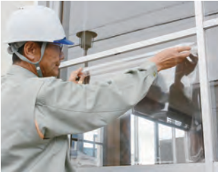
窓ガラス飛散防止フィルム (フィルム費用は約1平方メートルあたり約4000円。1階だけ)

申込書は、危機管理課(豊川市防災センター2階)、各支所にあります(市ホームページからダウンロード可)(1世帯当たり1年度1回だけ) その他 受付件数には限りがあります。また、1世帯につき固定する家具は3つ、フィルムを貼る窓ガラス(複層ガラスを除く)は4平方メートルまで、アパートなどの借家に住む方は、所有者の同意が必要です