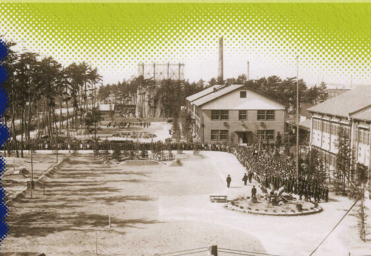
光学部・指揮兵器部事務所付近

〒442-0064 愛知県豊川市桜ヶ丘町79-2(豊川地域文化広場内) TEL(0533)85-3775 / FAX(0533)85-3776 http://www.city.toyokawa.lg.jp/enjoy/sakuragaokamuseum.html