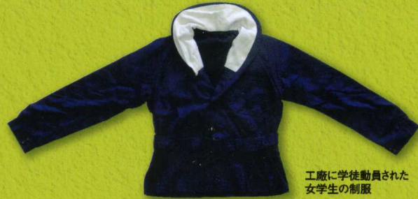
工廠に学徒動員された 女学生の制服