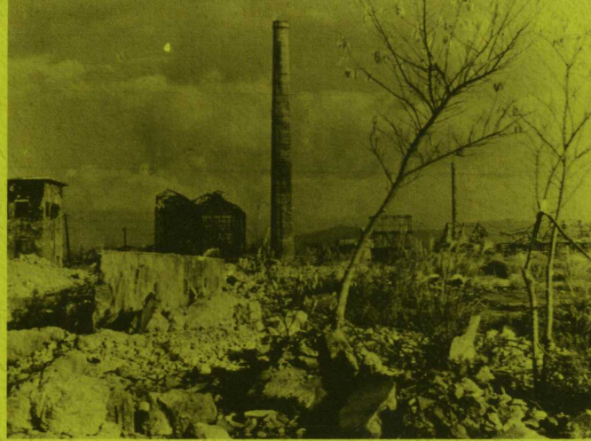
空襲による工廠の惨状