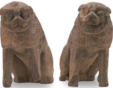
木造獅子・狛犬 室町時代 (砥鹿神社所蔵)

揃える前足・正面を向く顔・体に沿う様に流れる鬣などは平安時代の風を残すが、今にも動き出しそうな写実性の高い骨格・筋肉は鎌倉時代に見られる表現である。