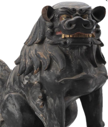
下長山熊野神社所蔵