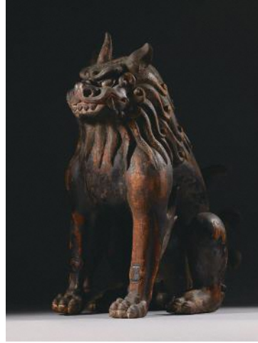
木造狛犬 鎌倉時代 (奈良国立博物館所蔵、重要文化財、画像提供:奈良国立博物館)

瀬戸窯所産の風体を示す狛犬が豊川市にも伝わっている。左右櫛目文の袴毛、櫛目文を伴う一段鬣など伊勝型の特徴を有する一方、香取型と共通する白眼である。簡素で素朴な佇まいは古様を感じさせ、引き締まった凛々しい顔つきには力強さがある。