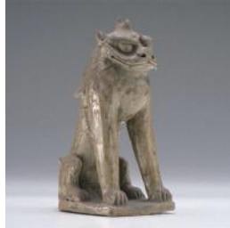
陶製狛犬 室町時代 (御津神社所蔵)

陶製狛犬の分類における「香取型」の標準像。瀬戸窯にて生産したものが遠く下総に伝わる点も興味深い。阿形は昭和51年発行の250円切手のモデルになった。