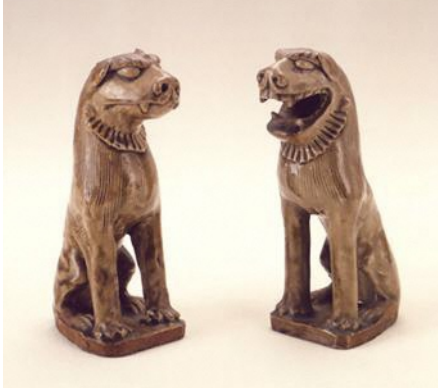
陶製獅子・狛犬 室町時代 (香取神宮所蔵、重要文化財、画像提供:香取神宮)

本展覧会では普段見ることのできない神楽狛犬に焦点をあて、その厳めしくも愛らしい霊獣の魅力に迫ります。