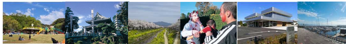
赤塚山公園 豊川稲荷(豊川閻魔殿) 佐奈川 どんき(長松寺) ござかい葵風館 御津マリーナ