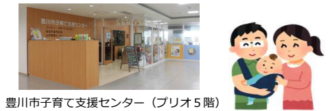
豊川市子育て支援センター（プリオ5階）