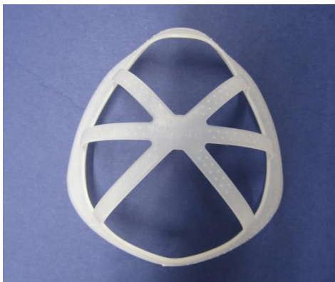
【マスクブラケット】