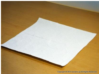
写真 1：紙マスクの材料と道具