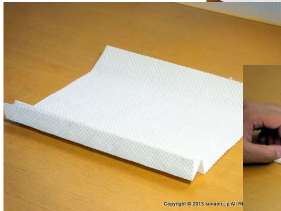
写真 2：紙を広げて置く