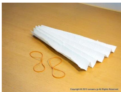
写真 4：どんどんおります

紙マスクの耳をつける輪ゴムを用意 紙を段々に折りきったら、それにゴムの耳をつけます。輪ゴムを 2 個ずつ結んでください。