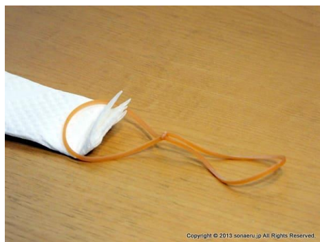
写真 5：輪ゴムを用意マスクの端を折って輪ゴムを引っかけて、マスクの端をホチキスで止める。輪ゴムを挟んだマスクの端を、ホチキスで留めて固定します。輪ゴムに針が刺さると切断されてしまうので、注意しましょう。

紙マスクの耳をつける輪ゴムを用意 紙を段々に折りきったら、それにゴムの耳をつけます。輪ゴムを 2 個ずつ結んでください。