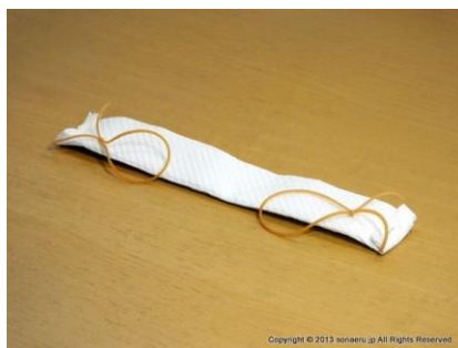
写真 7：たたんだ状態のマスク完成