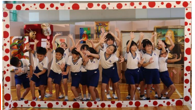
【3年生即興表現 「出られない!!」】

演劇の世界に、ぐいぐい引き込まれた子どもたち。多くの子が様々な表現活動を楽しみました。劇団の方々と、千両っ子で作る楽しい時間となりました。